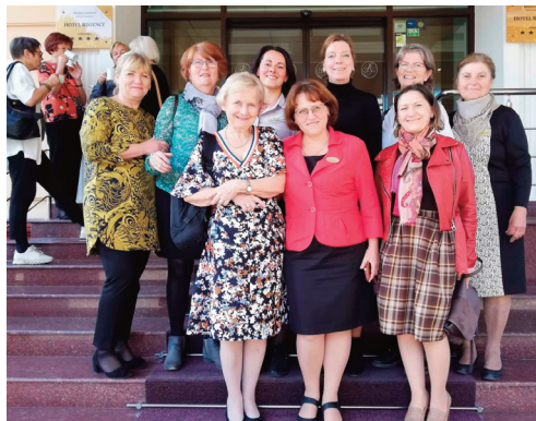
Besøk i Moldova 2019