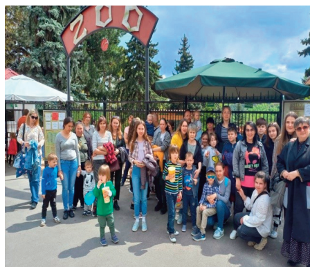
På tur med flyktinger fra Ukraina