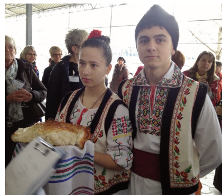
Velkomst med vin, brød og salt